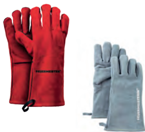
Lederhandschuh, rot FEUERMEISTERIN, grau geliefert je als Paar