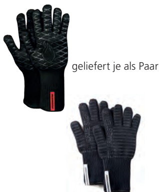
geliefert je als Paar